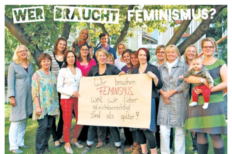
AG der Gleichstellungsbeauftragten der Region Hannover.

Die deutschen Anhängerinnen und Anhänger sind noch etwas zurückhaltender, insbesondere was die Fotobeiträge betrifft. Deswegen gibt es in der deutschsprachigen Variante neben den Aktionsständen auch noch andere aktivierende Kampagnen-Elemente wie Statements von prominenten Fürsprecherinnen und Fürsprechern, die gesammelt und verbreitet werden, und Gewinnspiele. Und deswegen wünscht sich das »Wer braucht Feminismus?«-Team, dass es noch mehr Menschen wie die AG der Gleichstellungsbeauftragten der Stadt Hannover gibt, die Feminismus ein Gesicht geben und sagen: »Wir brauchen Feminismus, weil wir lieber gleichberechtigt sind, als später!« ●