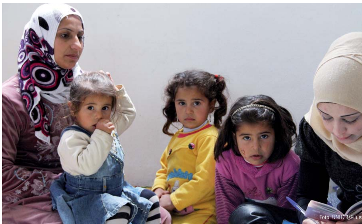
Syrische Flüchtlingsfamilie bei der Registrierung in Wadi Khaled, Libanon.

Gewerkschaften stehen für die Humanisierung der Arbeitswelt, die sich rasant verändert. Menschenwürde, Empathie und Solidarität sind Werte, die unser Handeln prägen. Deshalb fordert die IG BCE auf, sich nicht den Herausforderungen der Flüchtlingsbewegung zu entziehen, sondern zu handeln. Da, wo immer Gewerkschafterinnen und Gewerkschafter agieren, müssen unsere Vorstellungen eines menschenwürdigen Lebens adressiert werden an die Politik, an die Wirtschaft, an unsere Kolleginnen und Kollegen und auch an unsere Nachbarinnen und Nachbarn. Menschen verlassen ihr Land, weil sie Angst vor Zerstörung ihrer Existenz haben. Die Angst um ihr Leben und das ihrer Kinder ist so groß, dass sie vor dieser Gewalt fliehen. Oftmals traumatisiert, in hohem Maße verunsichert und ja, auch Sehnsucht nach ihrer